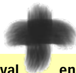
Pim & Pam