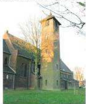
Theresiakerk Lauradorp

In het proces van samenwerking tussen parochies bedenken kerkbesturen tal van creatieve ideeën. In Landgraaf heeft het kerkbestuur van de samenwerkende parochies in Ubach over Worms een heel bijzondere oplossing bedacht om de exploitatiekosten van de kerk in Lauradorp naar beneden te brengen, zonder de kerk te sluiten. De Theresiakerk is voortaan alleen in de zomermaanden geopend. Hierdoor bespaart de parochie